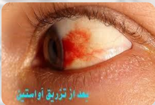
بعد از تزریق آواستین

افرادی که به بیماری های چشمی دچار هستند و پقرشقک تشخیص داده است که نیازمند تزری آواستین می باشند باید حتما طی مراجعات منظم تزری را انجام دهند تا چشم بیش از این درگیر نشود چرا که به راحتی کم شدن دید و در نهایت کوری حاصل خواهد شد. در این بین بیماران دیابتی باید اهمیت بیشتری به سالمقت چشم خود دهند زیرا بیش از سایر بیماران در معرض خطر قرار دارند .