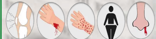
درد استخوان خونریزی آسان لکه های قرمز کاهش وزن خونریزی بینی