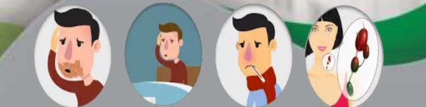
عفونت شدید عرق ربری شبانه تب کره های لنفی متورم